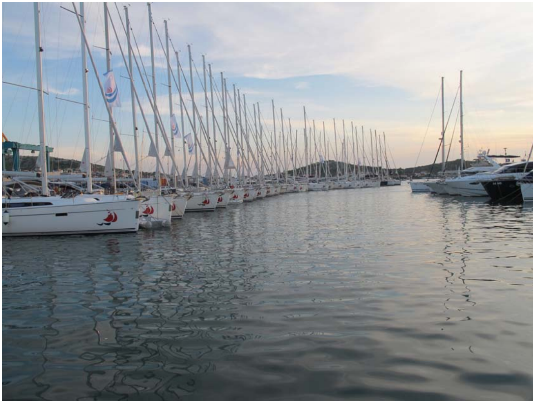
Murter, Marina Hramina (N43°49,53 / E015°35,54)

(* Distanzangaben entsprechen nicht der kürzesten Wegstrecke)