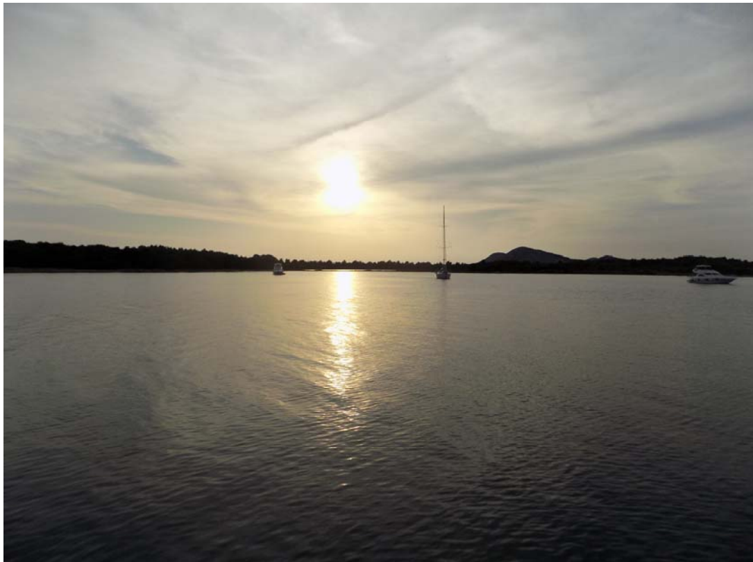
Festland, Bucht Vela Luka (N43°51,65 / E015°34,38)