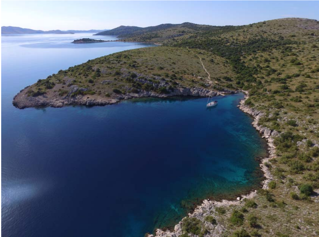
Žut, Bucht Platic (N43°50,08 / E015°20,9)

(* Distanzangaben entsprechen nicht der kürzesten Wegstrecke)