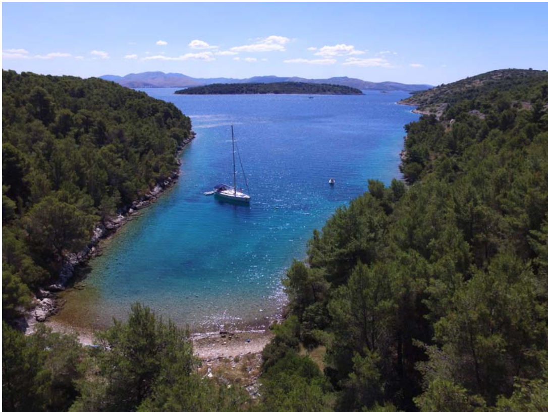
Zlarin, Bucht Magarna (N43°40,38 / E015°51,84)

(* Distanzangaben entsprechen nicht der kürzesten Wegstrecke)