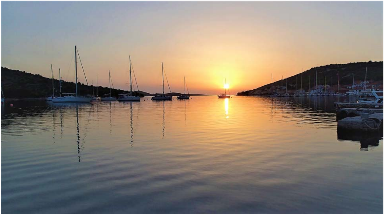
Kaprije, Inseldorf Kaprije (N43°41,15 / E015°42,53) (Bojenfeld & Anleger)

(* Distanzangaben entsprechen nicht der kürzesten Wegstrecke)