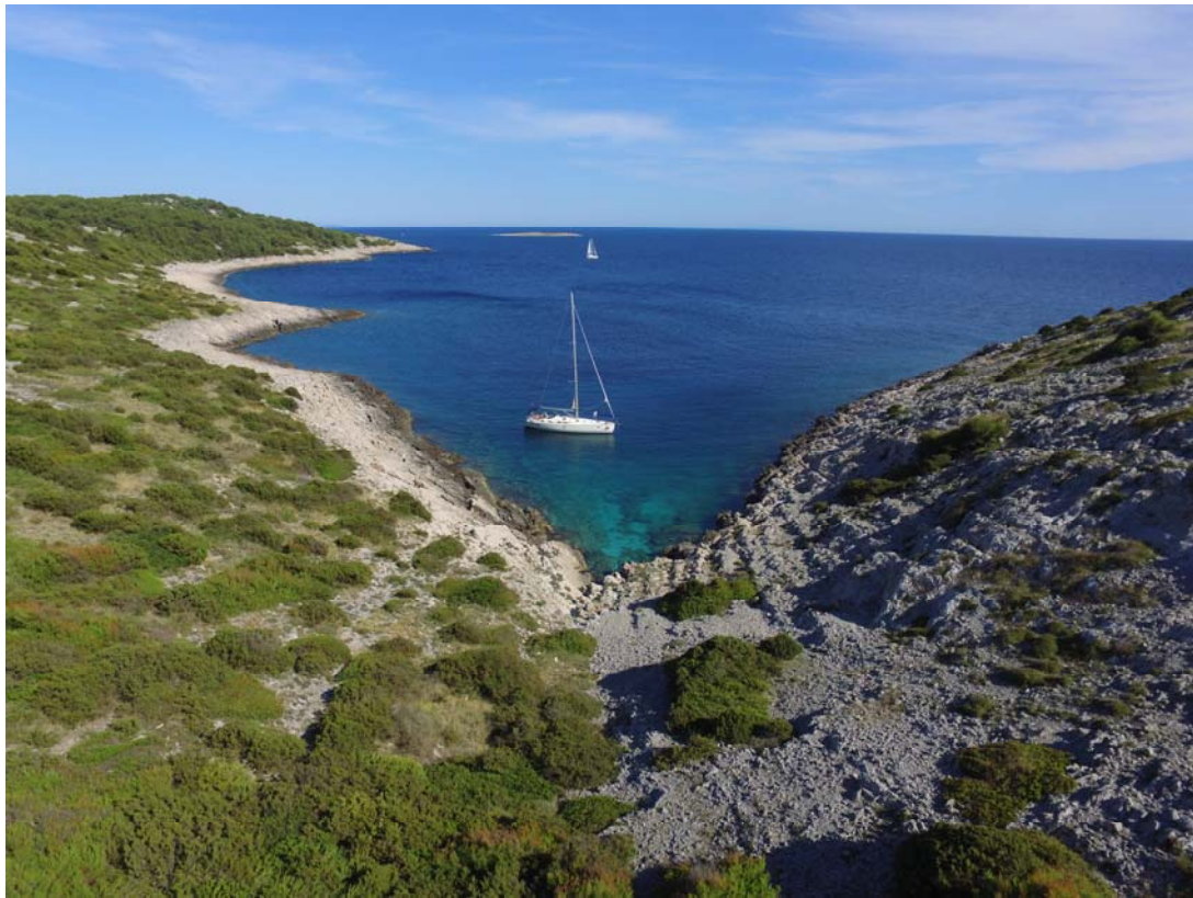
Žirje, Bucht Kruševica (N43°38,44 / E015°39,64)

(* Distanzangaben entsprechen nicht der kürzesten Wegstrecke)