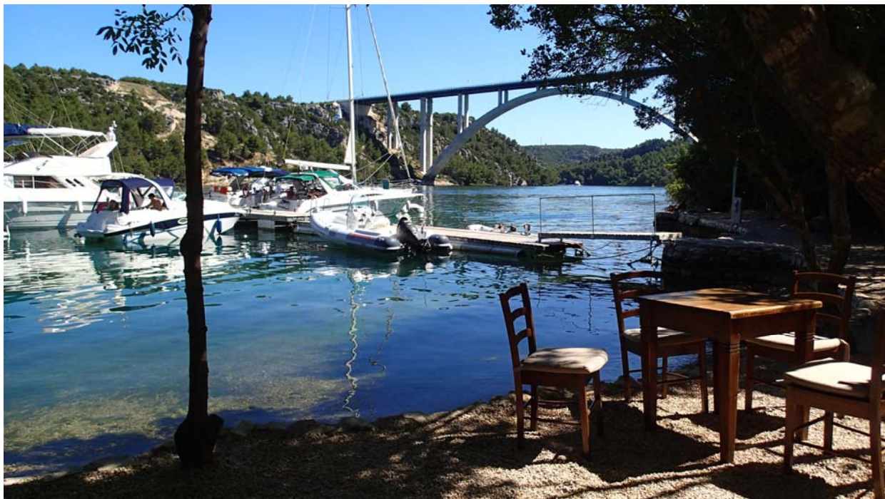
Skradin (N43°48,37 / E015°54,74) (Anleger Konoba Vidrovača)