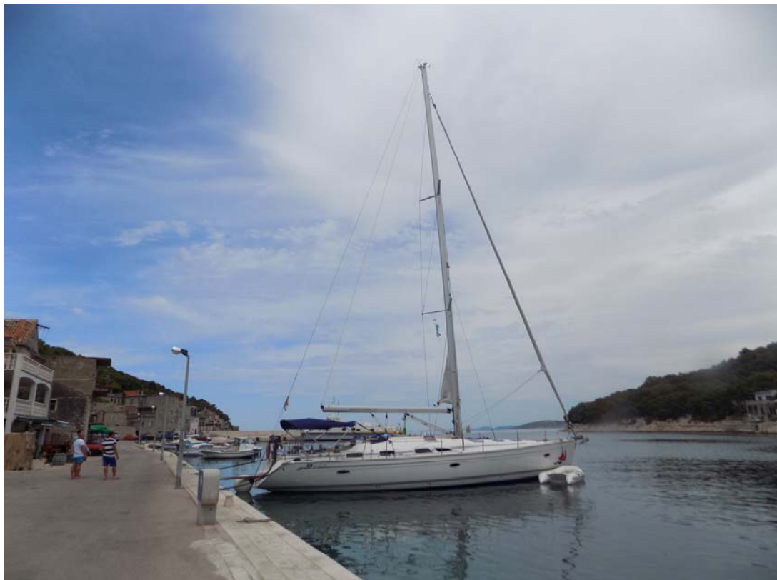
Žirje, Inseldorf Muna (N43°39,68 / E015°39,43).