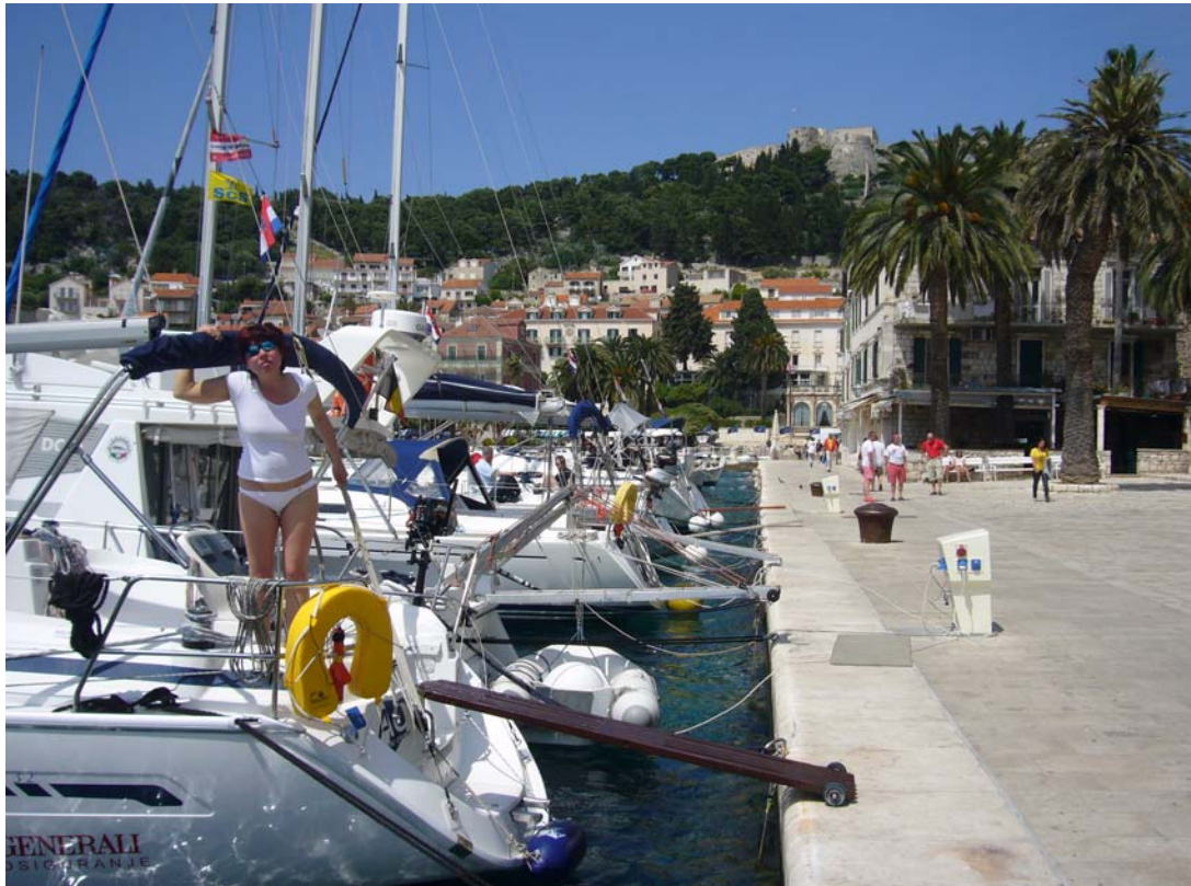
Hvar Stadthafen (N43°10,3 / E016°26,4)

2 Personen /1 Woche / Gesamtstrecke: 129 sm