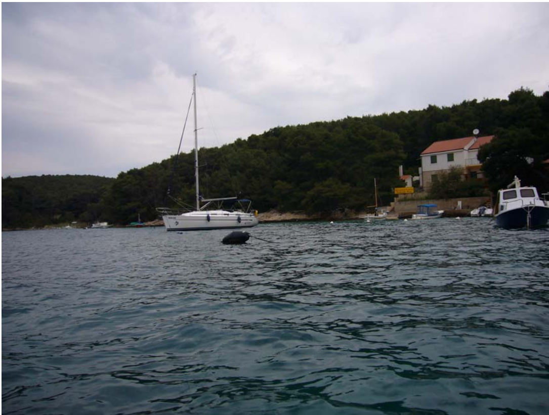
Korcula, Bucht Tri Luke

2 Personen /1 Woche / Gesamtstrecke: 129 sm