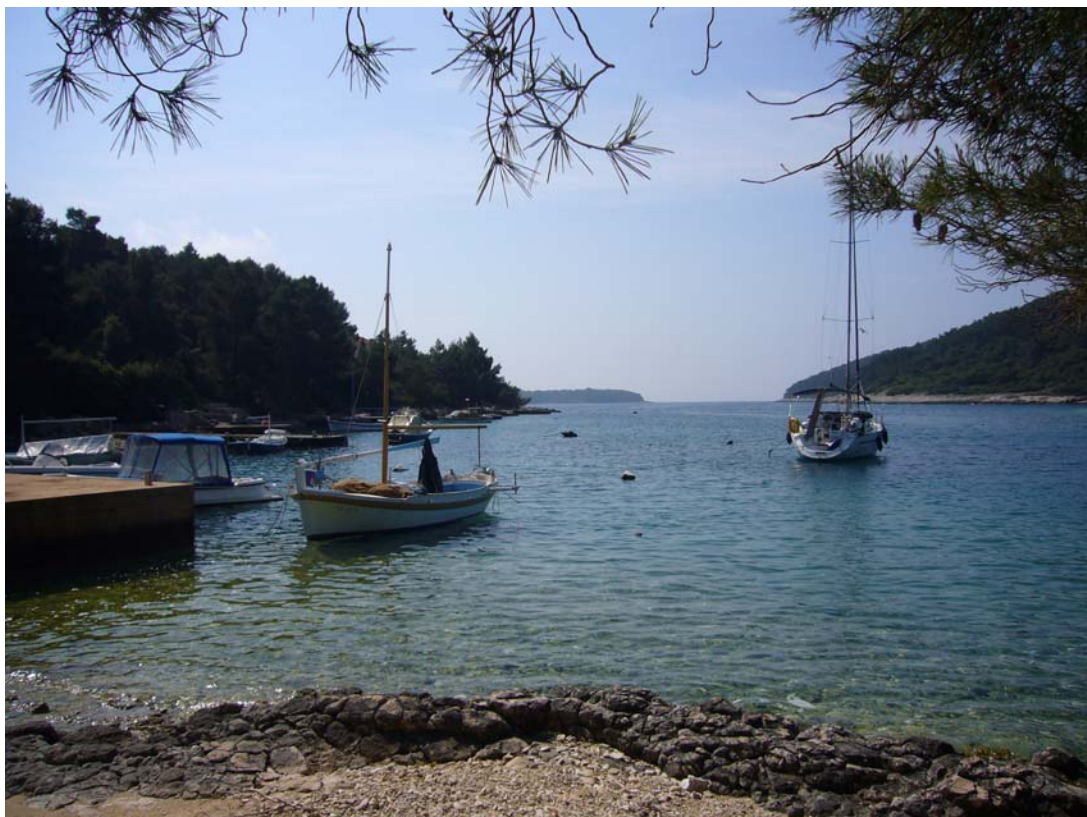
Korcula, Bucht Tri Luke (N42°55,7 / E016°39,9)