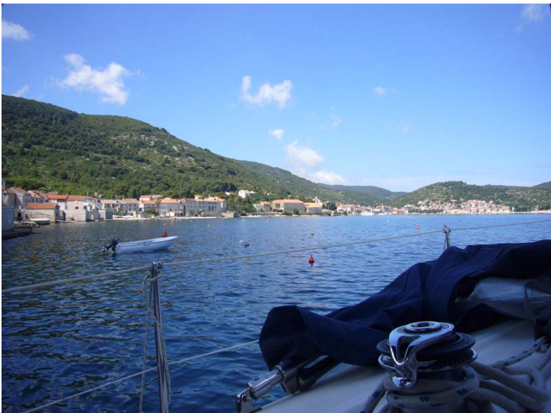
Kut Stadthafen mit Blick auf Vis Stadt (N43°03,5 / E016°11,9)