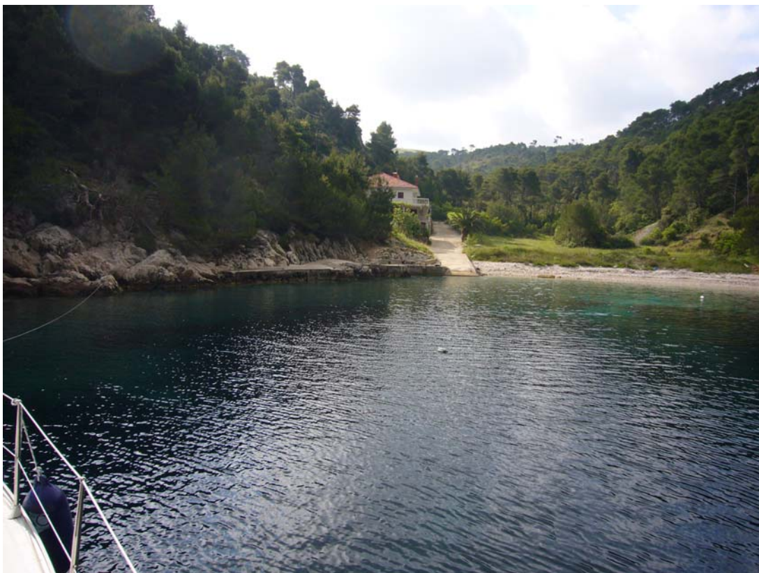
Hvar, Bucht Sviracina