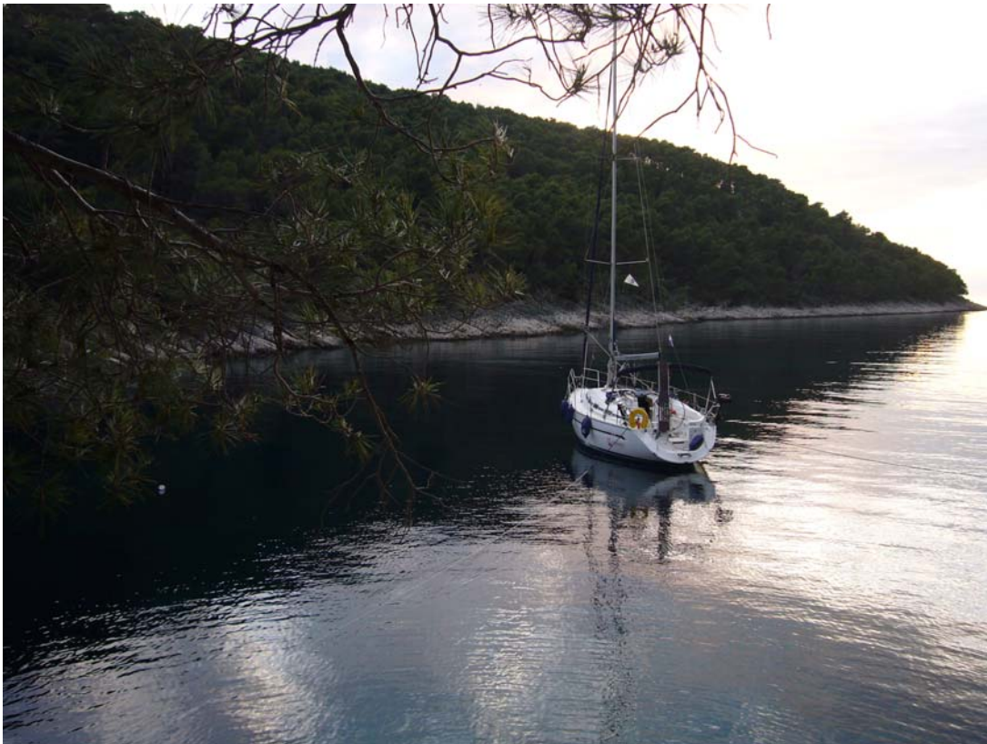
Hvar, Bucht Sviracina (N43°12,1 / E016°27,4)

2 Personen /1 Woche / Gesamtstrecke: 129 sm