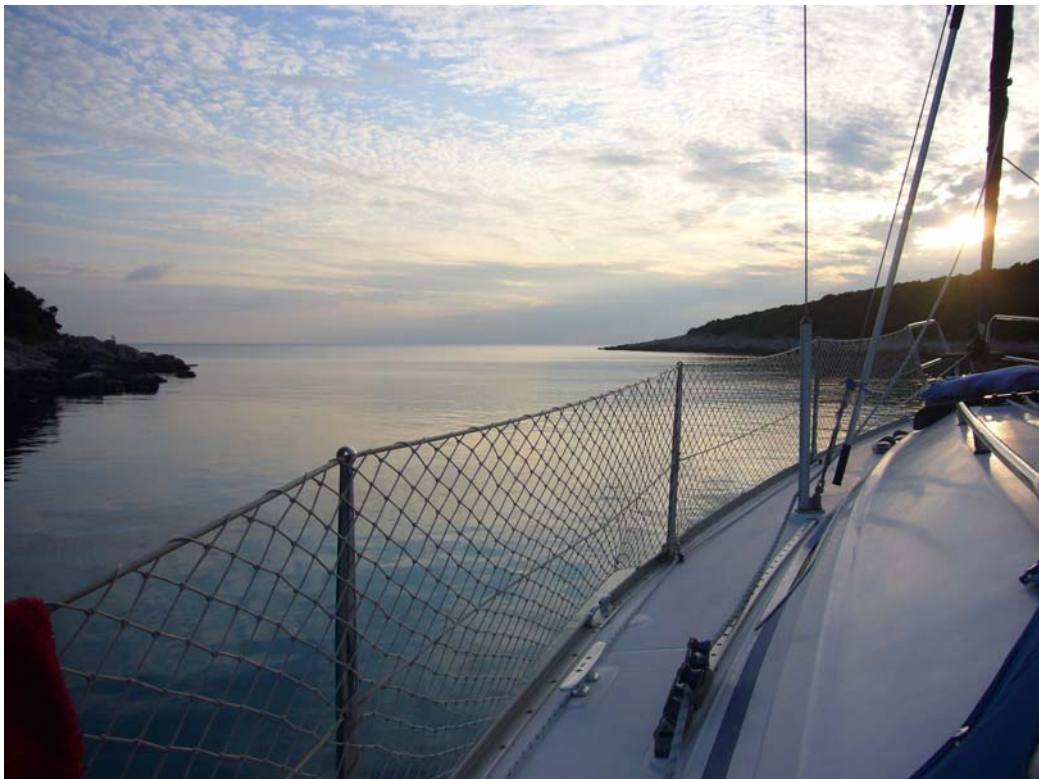
Insel Skarda, Bucht Lojisce