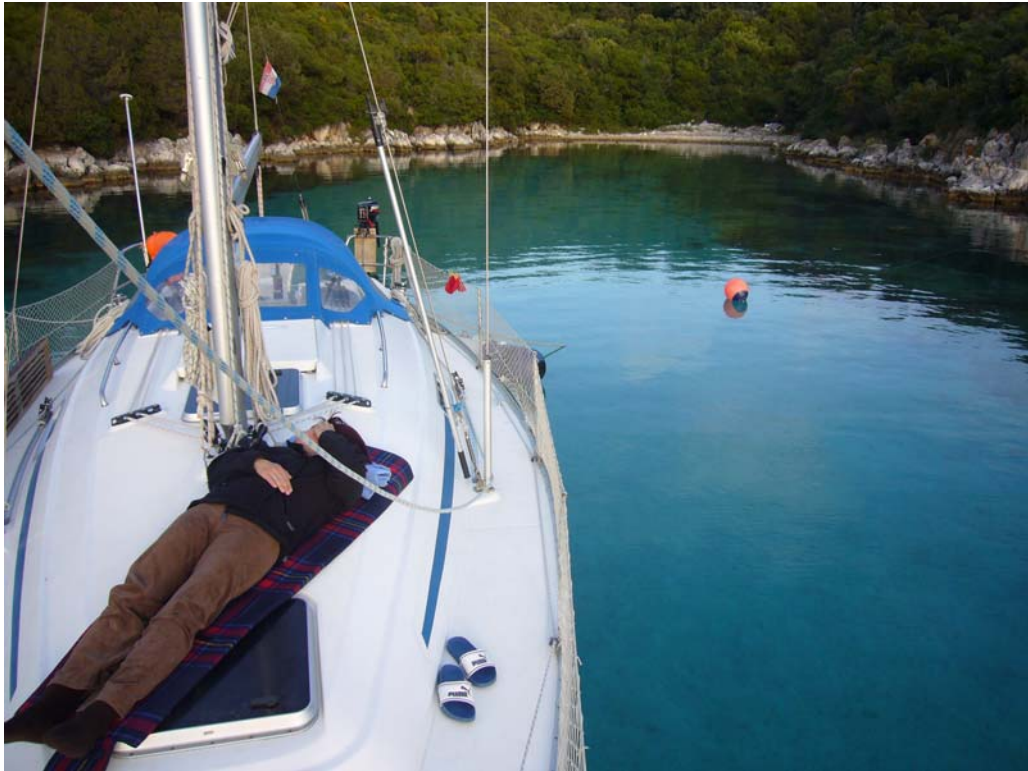
Insel Skarda, Bucht Lojisce (N44°16,9 / E014°41,9)

2 Personen /1 Woche / Gesamtstrecke: 129 sm