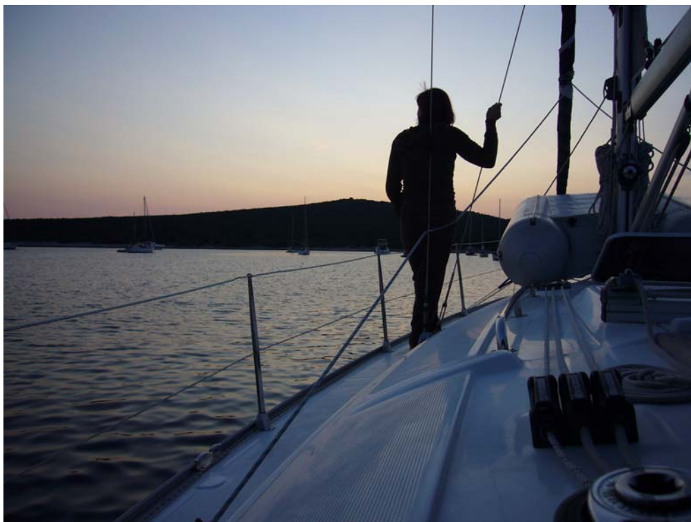
Insel Unije, Bucht Vognisca (N44°39,8 / E014°15,8)

2 Personen / 1 Woche / Gesamtstrecke: 148 sm