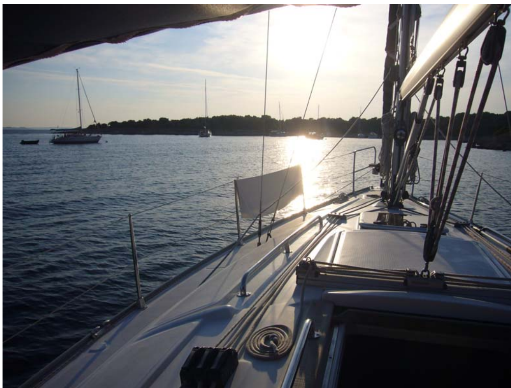
Insel Olib, Bucht Sv. Nikola (N44°21,2 / E014°46,5)